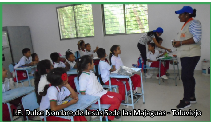
I.E. Dulce Nombre de Jesús Sede las Majaguas - Toluvejo