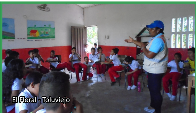
El Floral - Toluvejo