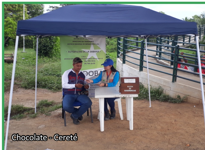
Chocolate - Cereté