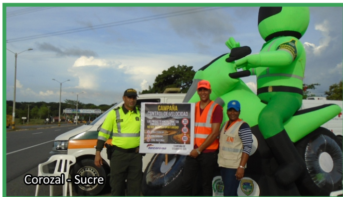
Corozal - Sucre