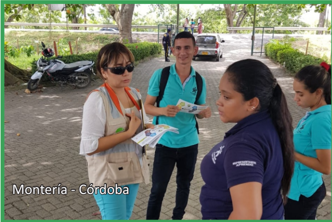
Montería - Córdoba

EL 19 de Julio 2018 se realizó jornada de sensibilización a instructores y estudiantes del Servicio Nacional de Aprendizaje SENA, en el Centro Agropecuario sub sede los Garzones de Montería sobre los deberes del peatón y su papel al momento de transitar. Alrededor de 20 personas fueron sensibilizados durante la jornada.