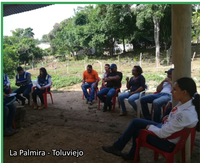
La Palmira - Toluvejo