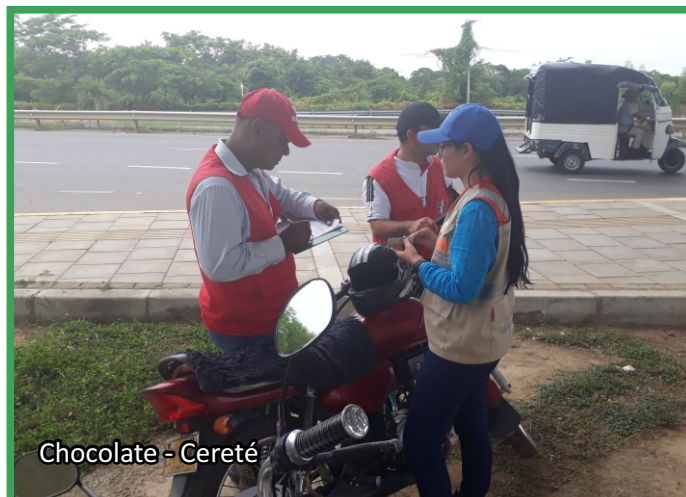
Chocolate - Cereté

Durante la segunda quincena del mes de julio de 2018, se realizó una oficina Móvil de atención al usuario en el departamento de Córdoba en la intersección Te Aeropuerto en el corregimiento Los Garzones de Montería, con el propósito suministrar información sobre la Concesión y fortalecer la relación del Concesionario con la Comunidad localizada dentro del área de influencia directa del proyecto o usuaria de los servicios.