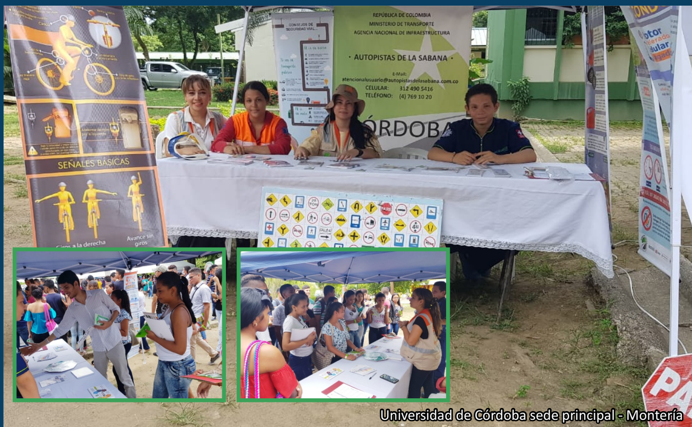
Universidad de Córdoba sede principal - Montería