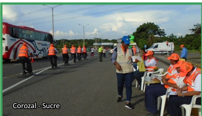
Corozal - Sucre

En esta oportunidad el Concesionario adelantó diferentes capacitaciones en instituciones educativas cómo El Floral a estudiantes de los grados 1ro, 2do, 3ro, 4to y 5to de primaria. Así mismo en la I.E. La Palmira a los estudiantes de grado noveno. Por otra parte en conjunto con la empresa de transporte público Torcoroma se realizó sensibilización a los conductores de la empresa y a los usuarios del corredor vial.