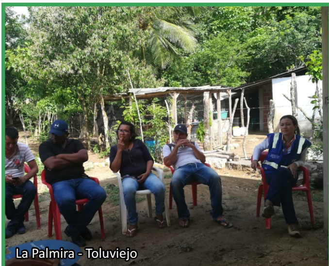
La Palmira - Toluvejo

En esta oportunidad se llevó a cabo reunión con la comunidad indígena La Palmira, con la cual se repasaron uno a uno los acuerdos y de ésta forma darle la verificación correspondiente.