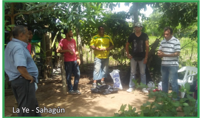
La Ye - Sahagún