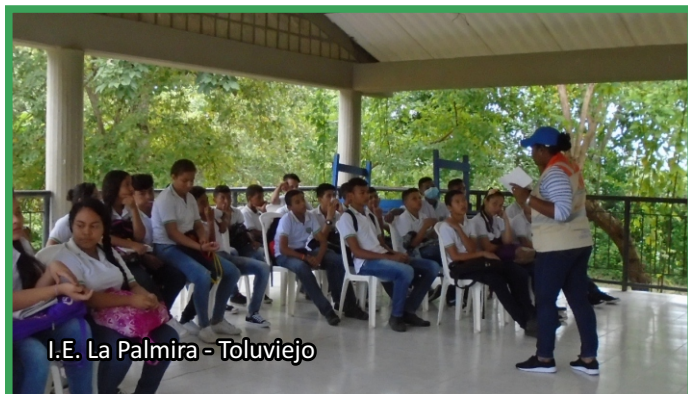
I.E. La Palmira - Toluvejo