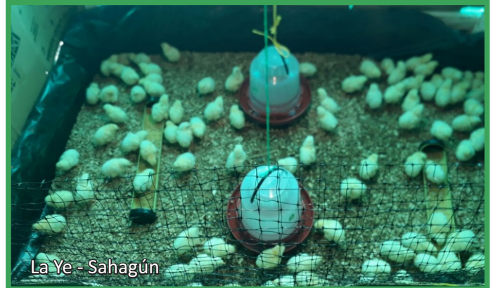
La Ye - Sahagún

Con la entrega de 100 pollos, alimento concentrado inicio y engorde, malla plástica gallinera, sulfato de calcio, bebedero para aves, plástico negro, anti estrés y antibióticos finalizó el curso de curso de Cría y Engorde de pollos en el corregimiento de la Ye en el municipio de Sahagún, gestionado por el Concesionario ante el Servicio Nacional de Aprendizaje SENA Córdoba.