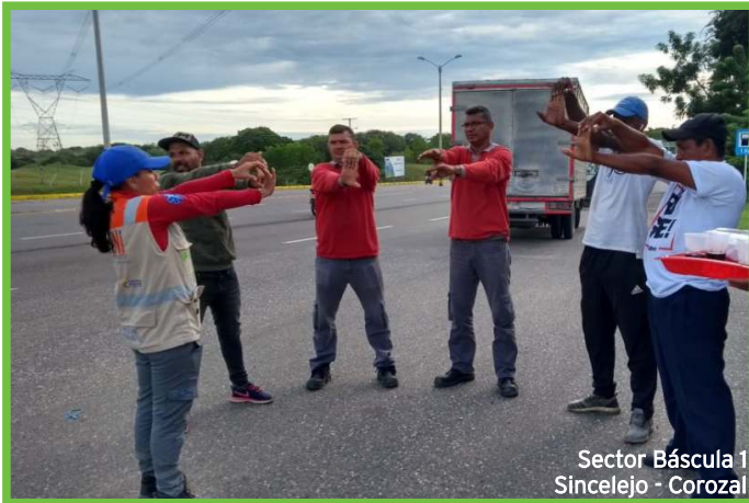
Sector Báscula 1 Sincelejo - Corozal

La actividad tuvo gran acogida por parte de estos actores viales, a quienes además de la charla se les realizó toma de presión arterial y pausas activas. De igual forma hicimos un llamado a los usuarios para que hagan uso del cinturón de seguridad y respeten las normas de tránsito con el fin de salvaguardar sus vidas y la de los demás actores viales.