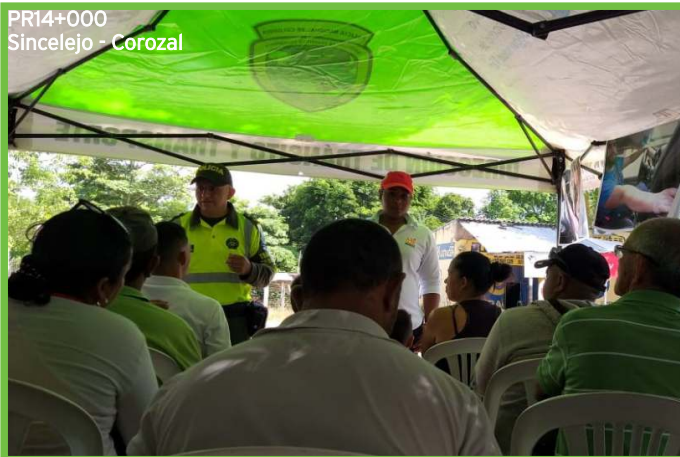
PR14+000 Sincelejo - Corozal