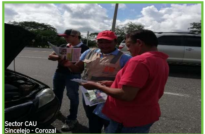
Sector CAU Sincelejo - Corozal