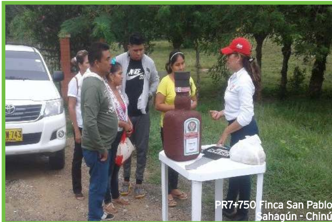
PR7+750 Finca San Pablo Sahagún - Chinú

La jornada tuvo lugar en el PR79+750, a la altura de la Finca San Pablo vía Sahagún - Chinú, el 23 de Septiembre/2019, bajo el lema "Soy el llave responsable". Agradecemos el apoyo de la Seccional de Tránsito y Transporte de la Policía Nacional y personal del Área de Operaciones de la Concesión.