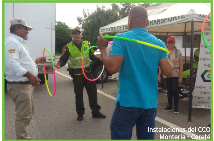
Instalaciones del CCO Montería - Cereté