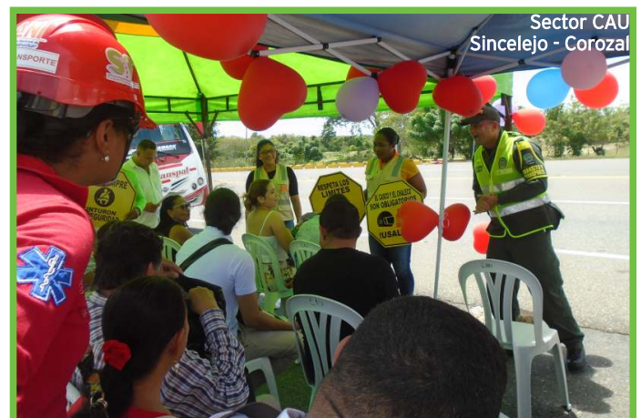
Sector CAU Sincelejo - Corozal