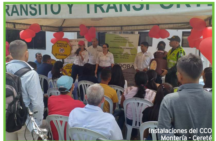
Instalaciones del CCO Montería - Cereté

Las actividades fueron dirigidas a todos los actores viales y se trataron temas como límites de velocidad, embriaguez, uso de elementos de protección personal y como ser visibles en la vía. La Concesión hizo entrega de bolsas ecológicas a los conductores de vehículos y rifó anquetas de dulces entre los asistentes, agradecemos el apoyo de la Secretaria de Tránsito y Transporte Departamental de Córdoba y la Seccional de Tránsito y Transporte de la Policía Nacional de Córdoba y Sucre.