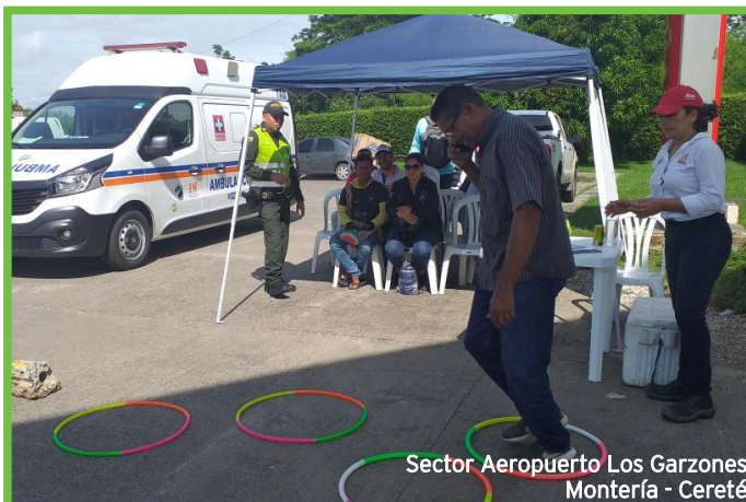
Sector Aeropuerto Los Garzones Montería - Cereté

La concentración en la vía al momento de conducir o maniobrar una motocicleta es vital para prevenir accidentes de tránsito, por lo anterior capacitamos a peatones, motociclistas y conductores sobre los factores internos y externos que afectan la atención al conducir.