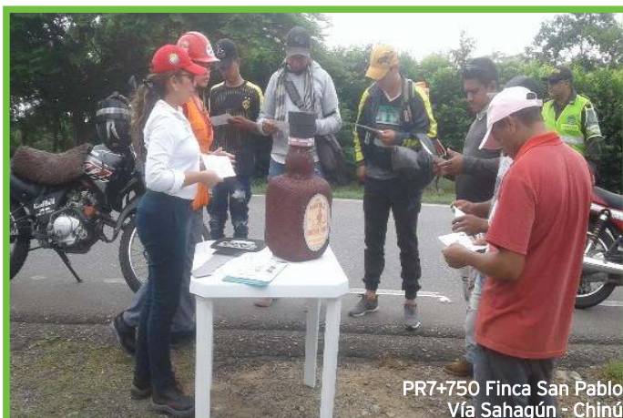
PR7+750 Finca San Pablo Vía Sahagún - Chinú