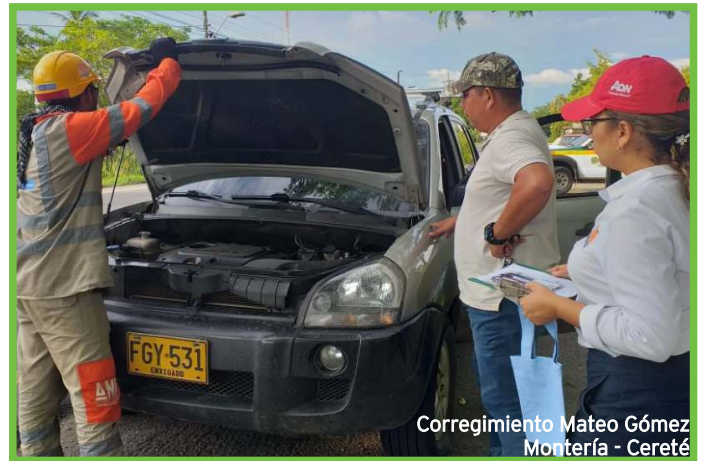
Corregimiento Mateo Gómez Montería - Cereté

Estas jornadas buscan sensibilizar a los usuarios sobre la importancia de mantener los vehículos en buen estado y revisar los factores mecánicos que originan los accidentes de tránsito. Agradecemos el apoyo de la Seccional de Tránsito y Transporte de la Policía Nacional y personal del Área de Operaciones de la Concesión.