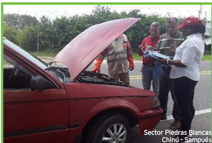
Sector Piedras Blancas Chinú - Sampués

La Concesión a través del programa de movilidad segura, implementa estrategias con el fin de prevenir los accidentes de tránsito. Teniendo en cuenta lo anterior, se realizó el pasado 11 de Septiembre/2019, 2 brigadas de mantenimiento preventivo a vehículos que transitaban a la altura de la Finca Villa María PR63 de Sahagún y el sector Piedras Blancas PR99+900 en Sampués.