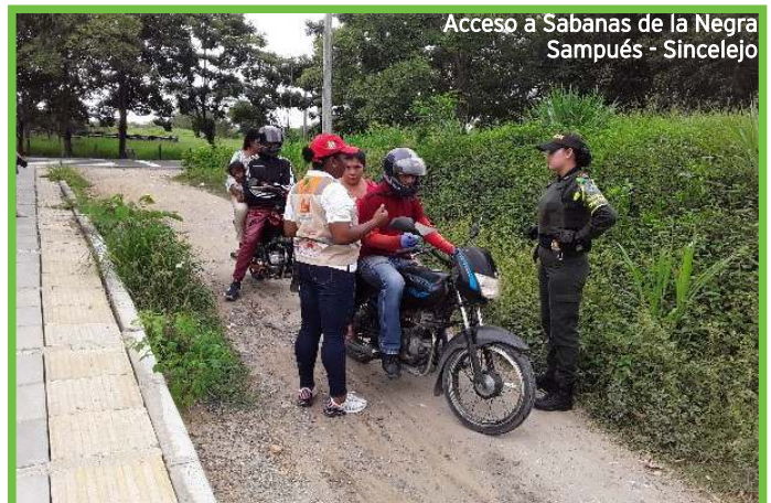
Acceso a Sabanas de la Negra Sampués - Sincelejo

En compañía de oficiales adscritos a la Seccional de Tránsito y Transporte de la Policía Nacional, entregamos volantes con recomendaciones para la movilidad peatonal a fin de evitar accidentes de tránsito.