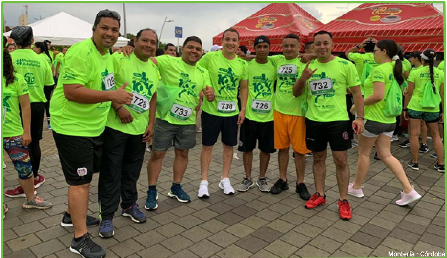
Montería - Córdoba