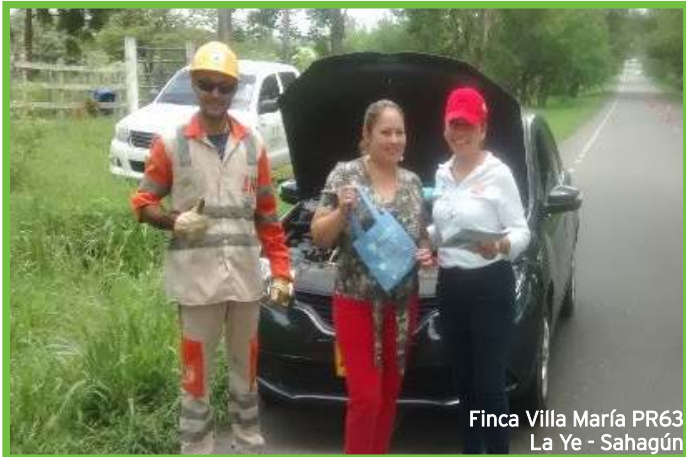
Finca Villa María PR63 La Ye - Sahagún