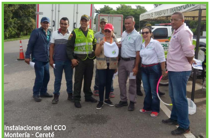
Instalaciones del CCO Montería - Cereté