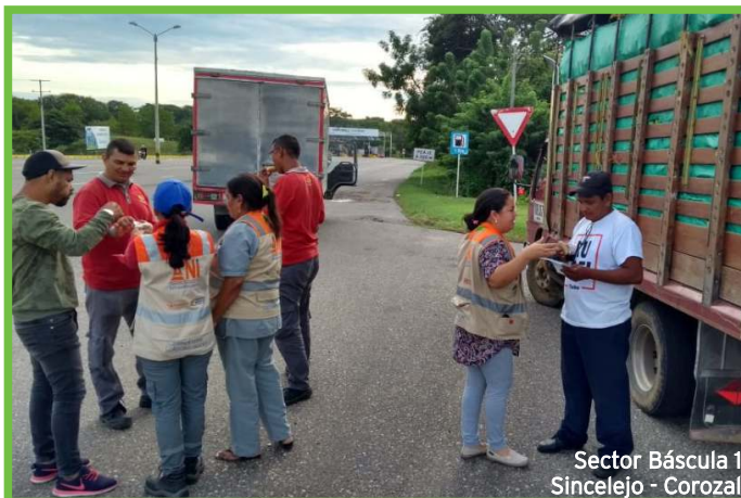
Sector Báscula 1 Sincelejo - Corozal