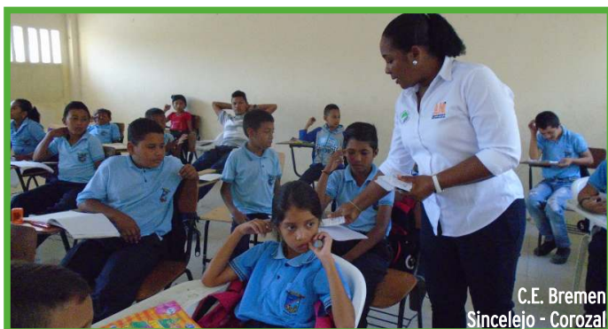
C.E. Bremen Sincelajo - Corozal