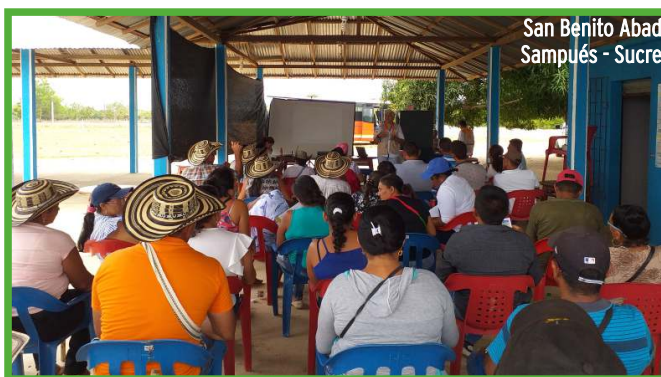
San Benito Abad Sampués - Sucre

El Ministerio del Interior realizó reunión de consulta previa el pasado 29 de Marzo /2019, lo anterior en el marco de la etapa de seguimiento de acuerdos con las comunidades indígenas Lomas de Palito y Sabanalarga de Palito en cumplimiento de la sentencia T-436 DE 2016 de la Corte Constitucional en el marco del proyecto: Construcción de la segunda calzada de Sincelajo - Tolvujejo que comprende desde el KO + 000 al K1+500 y del K1+500 al K17+000. En esta oportunidad se dieron por cumplidos todos los acuerdos, logrando así el cierre de la consulta con estos dos cabildos.