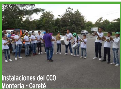
Instalaciones del CCO Montería - Cereté