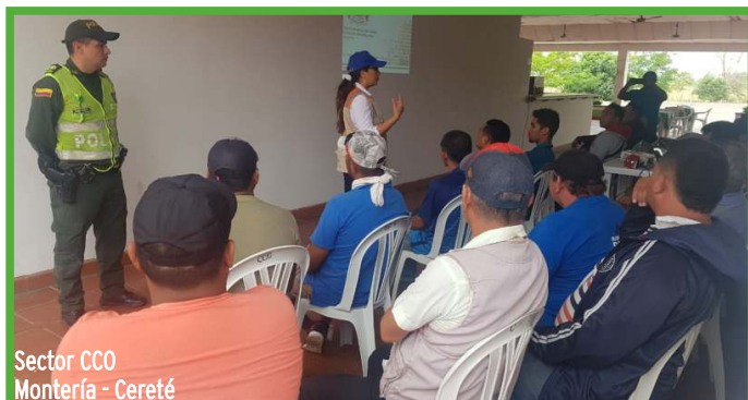
Sector CCO Montería - Cereté

Autopistas de la Sabana S.A.S. agradece el apoyo de las diferentes instituciones de orden local, regional y nacional como Alcaldías, Secretarías de Tránsito Municipales y Departamentales y Policía Nacional, de igual forma a las Instituciones Educativas que se vinculan a estas jornadas.