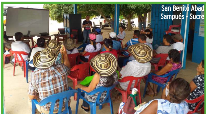
San Benito Abad Sampués - Sucre

Esta actividad contó con la presencia de representantes del Ministerio del Interior, consorcio AIG Interventoría, directivos de los cabildos asistentes y representantes de la Concesión Autopistas de la Sabana S.A.S.