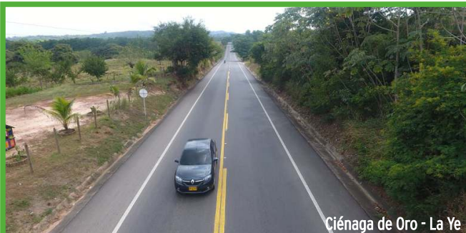
Ciénaga de Oro - La Ye