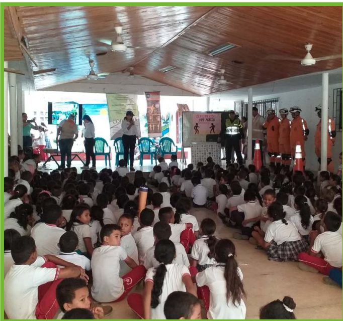
IE San Francisco de Asís, Fe y Alegría - Berástegui