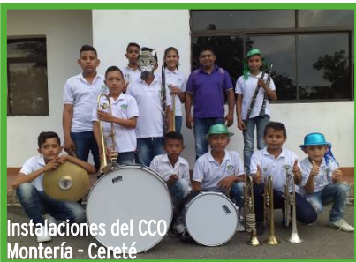
Instalaciones del CCO Montería - Cereté

Autopistas de la Sabana S.A.S., a través del programa Iniciativas, impulsa el emprendimiento económico y cultural del AID. En esta ocasión se donaron materiales de infraestructura para la adecuación del lugar de practicas y dotación (uniformes) para los niños que integran la Banda Folclórica de Berástegui.