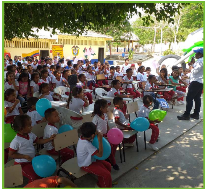
CE Bremen, Vía Sincelejo - Corozal

El Concesionario Autopistas de la Sabana S.A.S. realizó a través del Área Social, 6 caravanas de seguridad vial "De regreso al cole" en diferentes instituciones educativas de los departamentos de Córdoba y Sucre, en las cuales capacitamos alrededor de 1250 estudiantes en temas relacionados con: conocimiento de las señales de tránsito y su clasificación, deberes del peatón, recomendaciones para la movilidad en motocicleta, uso de los elementos de protección personal (casco y chaleco) y protocolos de actuación después de un accidente de tránsito, entre otros.