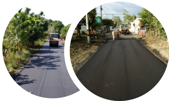
Mantenimiento Periódico Tramo Conectante San José del Quemado.

De acuerdo al plan de mantenimiento vial, durante el año 2023 se continúa con las actividades de repavimentación a cargo de Autopistas de la Sabana S.A.S.