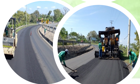
Tramo Sincelejo – Tolviejo calzada izquierda PR0+000 al PR3+000.