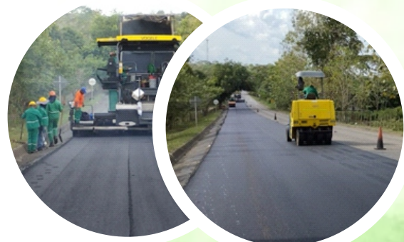
Tramo Ciénaga de Oro – La Ye PR20+000 al PR27+000.