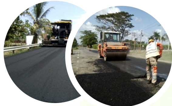
Tramo Cereté – Ciénaga de Oro calzada izquierda PR0+000 al PR9+000.