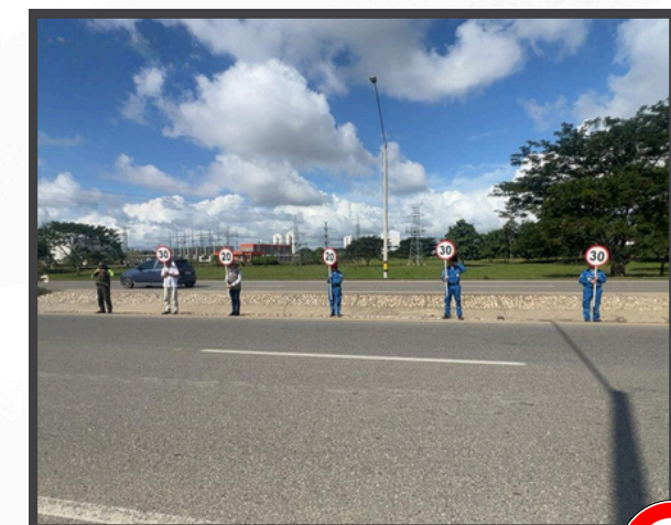
Sensibilización a conductores y motociclistas en la Paralela Circunvalar de Montería