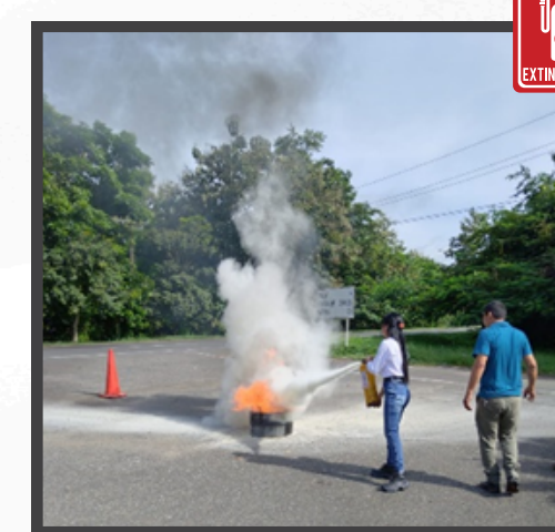
Práctica realizada en el Centro de Control de Operaciones-Cereté