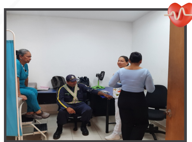
Toma de presión y peso en el Centro de Control de Operaciones-Cereté