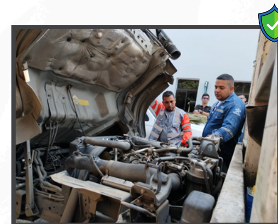
Capacitación Teórica (observativa) realizada en el Centro de Control de Operaciones-Cereté