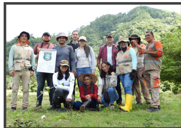
Caminata Ambiental de observación educativa

El concesionario buscó con estas actividades de sensibilización, promover entre la comunidad estudiantil, autoridades y organizaciones ambientalistas, la continuidad de acciones de preservación y restauración ecológica a corto, mediano y largo plazo, acompañada con proyectos investigativos dentro de estas áreas de compensación.