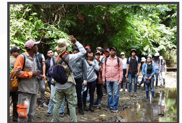
Caminata Ambiental de observación educativa

El objetivo principal de dichas actividades consistió en mostrar el estado actual de las acciones de preservación y de restauración ecológica implementadas dentro de los nueve predios que conforman el área de compensación las cuales se localizan en las subcuencas la Siria, las Piedras, la Mena y la Granja, que hacen parte de la cuenca baja del arroyo Pechelín.