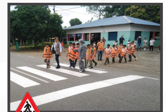
Jornada realizada en el Tramo La Ye - Sahagún Institución Educativa las Manuelitas