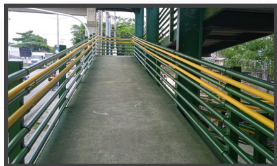
Puente Peatonal UNICORDOBA Tramo Postobón - Te Aeropuerto