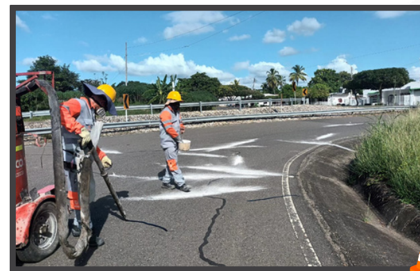
Sello de Grietas y Fisuras en el Tramo La Ye - Sahagún