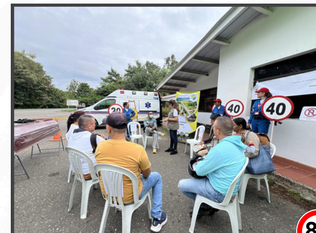
Jornada realizada en el Tramo Montería - Cereté