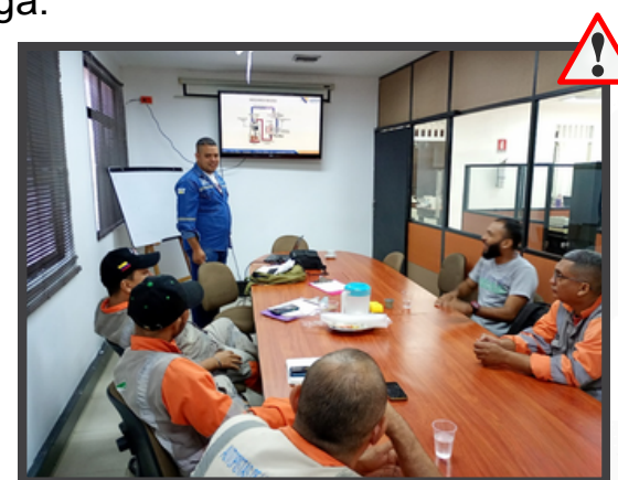
Capacitación Teórica realizada en el Centro de Control de Operaciones-Cereté

Se abordaron temas sobre especificaciones de vehículos pesados y las regulaciones de seguridad vial. Así como la relevancia de realizar inspecciones antes de emprender viaje, la adecuada distribución y aseguramiento de la carga.