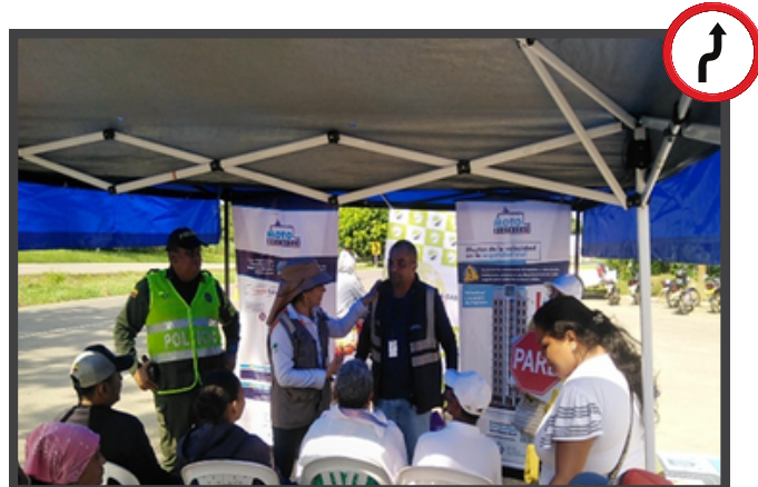
Tramo Ciénaga de Oro - La Ye