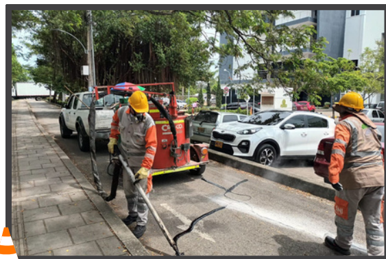
Mantenimiento en el Tramo Montería (Postobón) - Té Aeropuerto

Autopistas de la Sabana S.A.S., sigue realizando actividades de limpieza, sello fisuras, refuerzo de demarcación horizontal y pintura de bordillos en las ciclorrutas que se encuentran dentro del corredor vial.