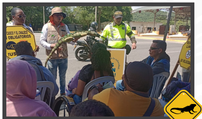
Tramo Sincelejo - Toluviéjo Sector Sierra Flor