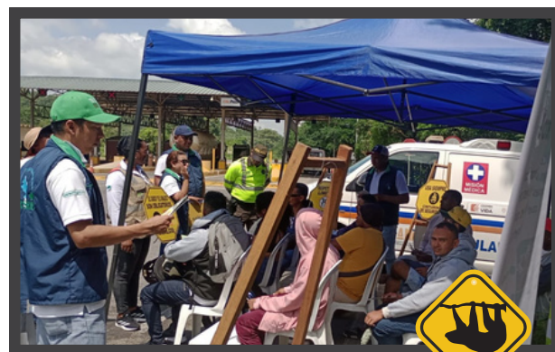
Tramo Sincelejo - Toluviéjo Sector Sierra Flor

Autopistas de la Sabana S.A.S., promovió el control en los límites de velocidad, la no distracción durante la conducción para prevenir la siniestralidad y el atropellamiento de fauna silvestre que transita sobre la vía en el área de influencia del proyecto Córdoba y Sucre.