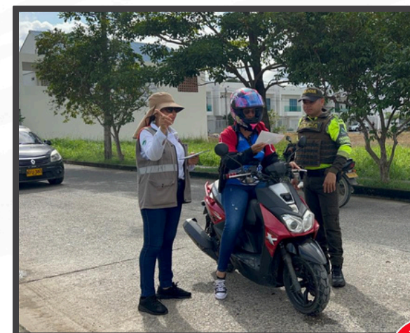
Sensibilización a conductores y motociclistas en la Paralela Circunvalar de Montería

Autopistas de la Sabana S.A.S., promovió el respeto por la vida y el uso adecuado de los retornos al conducir para prevenir siniestros viales y reducir la accidentalidad.