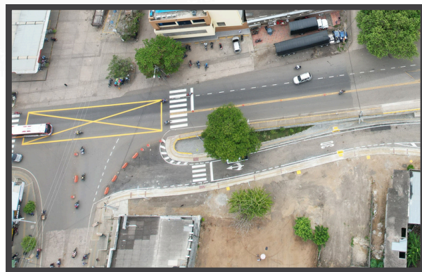
Vista Superior general de obra

El concesionario vial ha finalizado las actividades constructivas del proyecto "Construcción de la salida desde la Calle 4 (Pavimento Flexible) y obras de urbanismo en la intersección Calle 4A con Ruta Nacional 21- cra 25 en el municipio de Santa Cruz de Lorica". Dicho proyecto, tuvo como objetivo mejorar la movilidad en el sector, facilitando el flujo vehicular y peatonal.