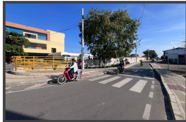
CII 4 de acceso a la ruta 21

Es importante mencionar que el proyecto es una responsabilidad conjunta con la Alcaldía Municipal de Santa Cruz de Lorica, entidad a la cual le corresponde la instalación del alumbrado público y semáforos para implementación de una intersección semaforica, necesaria para mejorar la movilidad de la Vía Nacional con el Centro Histórico de Lorica.