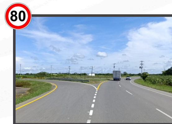
Refuerzo de Señalización Horizontal Tramo Chinú - Sampedúes