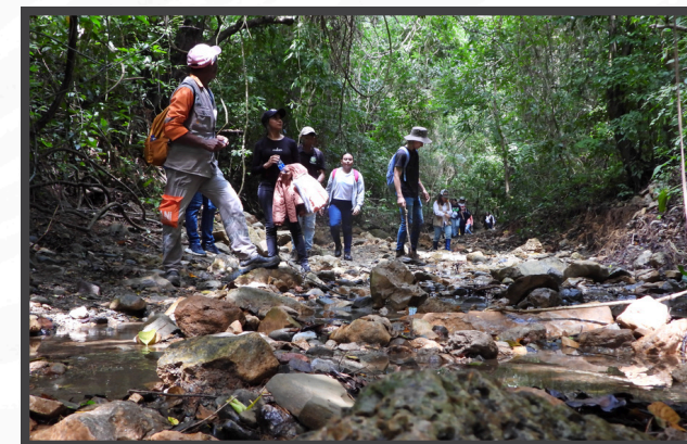
Caminata Ambiental de observación educativa

Caminata Ambiental de observación educativa durante el segundo semestre del año en curso realizaron actividades de educación y concientización ambiental dirigidas a estudiantes de instituciones educativas aledañas al proyecto, profesores y estudiantes de la Universidad de Sucre, de la Corporación Universitaria del Caribe, como también a funcionarios de la Corporación Autónoma Regional de Sucre y la Organización Ambientalista Guardia Ambiental Sucre.