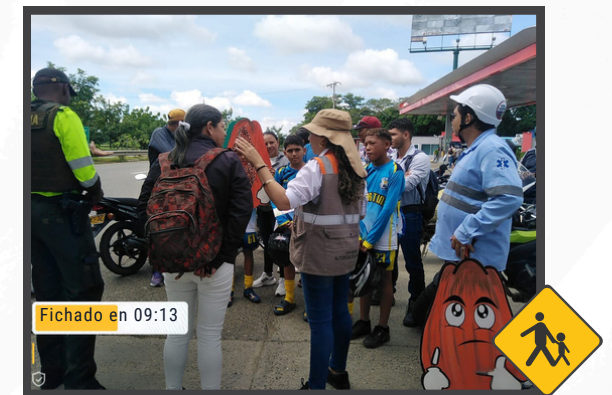
Jornada Realizada en el Tramo Montería (Postobón) - Te Aeropuerto