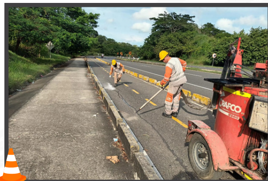
Mantenimiento en el Tramo Sincelejo - Corozal