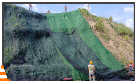
Instalación de Taludes en el Tramo Sincelejo Tolviejo Sector Sierra Flor

El concesionario vial continúa realizando la instalación del sistema integral para protección de taludes y control de erosión en el sector de Sierra Flor, tramo Sincelejo - Tolviejo; el sistema incluye manto control de erosión, malla, construcción de cunetas e instalación de bajantes para garantizar su correcto funcionamiento.