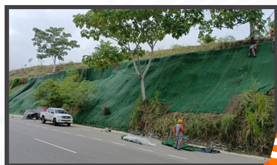
Instalación de Taludes en el Tramo Sincelejo Tolviejo Sector Sierra Flor