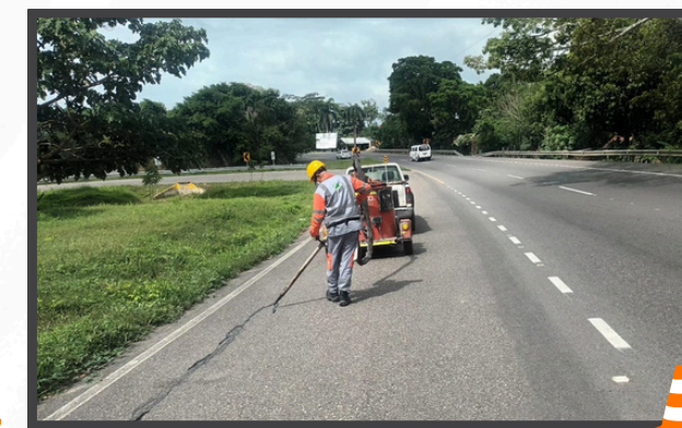
Sello de Grietas y Fisuras en el Tramo Sincelejo - Sampedúes