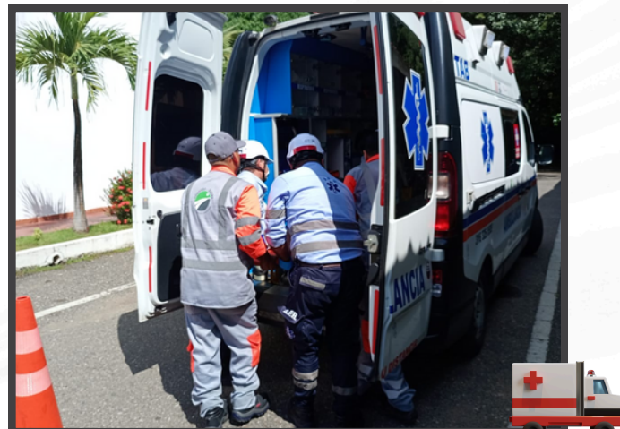
Simulacro realizado en el Centro de Control de Operaciones-Cereté