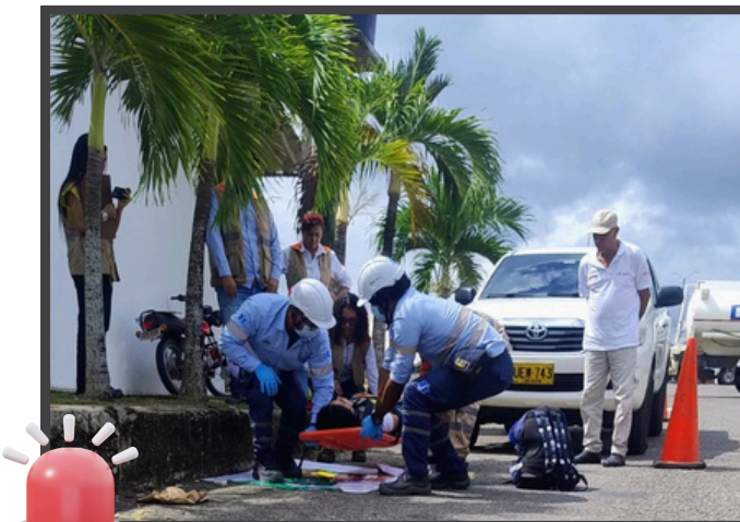
Simulacro realizado en el Centro de Atención al Usuario-Corozal

En el simulacro de emergencia, los colaboradores adquirieron conocimientos claves sobre las rutas de evacuación, el uso de equipos de seguridad y la comunicación efectiva durante cualquier crisis que se llegara a presentar.