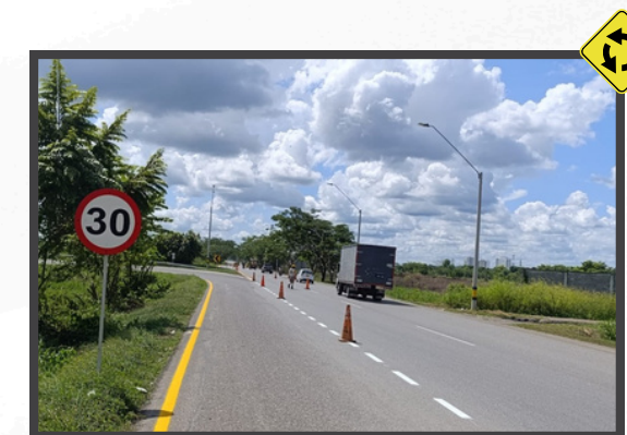
Refuerzo de Señalización Horizontal Tramo Te Aeropuerto - Cereté