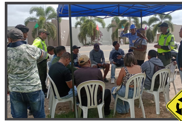
Jornada realizada en el Tramo Sampués-Sincelejo

Durante el trimestre de octubre a diciembre de 2024, Autopistas de la Sabana S.A.S., lanzó la campaña "RUEDA CON SEGURIDAD, TU FAMILIA TE ESPERA" para fomentar comportamientos responsables en la vía. La iniciativa incluyó jornadas de sensibilización y capacitación sobre el respeto a las señales de tránsito, el uso de Elementos de Protección Personal (EPP) y el respeto por los límites de velocidad, con el objetivo de promover una movilidad segura en los departamento de Córdoba y Sucre.