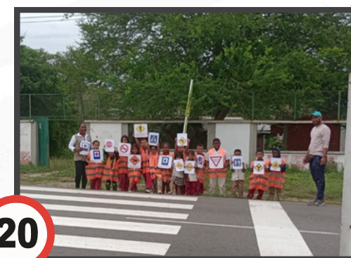
Jornada realizada en el Tramo Sincelejo - Tolviejo Institución Educativa Dulce Nombre de Jesús

Autopistas de la Sabana S.A.S., a través de capacitaciones promovió el uso de la cebra peatonal y el respeto a las señales de tránsito en los departamentos de Córdoba y Sucre.