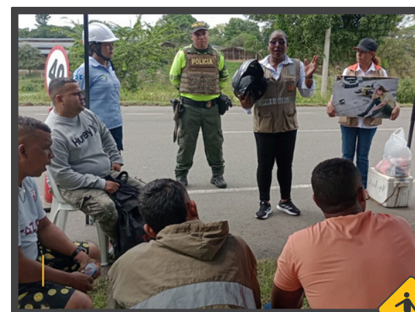
Jornada realizada en el Tramo Sincelejo - Tolviejo

Durante el mes de noviembre del presente año, las concesiones viales Autopistas de la Sabana S.A.S. y Ruta al Mar S.A.S., la Secretaría de Tránsito Departamental de Córdoba, Secretaría de Tránsito Municipal de Montería, la Policía de Tránsito y Transporte de Montería, la Cruz Roja y la Agencia Nacional de Seguridad Vial se unieron con el fin de dar a conocer los protocolos de actuación después de un siniestro vial, el buen uso de los Elementos de Protección Personal (EPP) y el hacerse visibles en la vía.