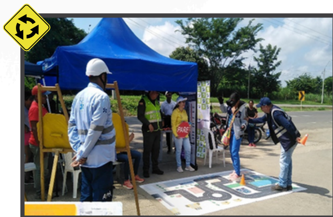
Tramo Ciénaga de Oro - La Ye

El concesionario vial impulsó el uso adecuado del casco como Elemento de Protección Personal (EPP), de igual forma, la importancia de controlar los límites de velocidad en la vía.