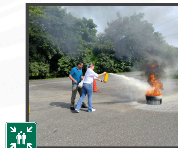
Práctica realizada en el Centro de Control de Operaciones-Cereté

Se impartió conocimiento sobre los diferentes tipos de extintores y su aplicación según el tipo de fuego, el método correcto de uso, y la identificación de extintores según su clasificación. También se trató la importancia de las inspecciones periódicas para asegurar su operatividad y accesibilidad en emergencias.